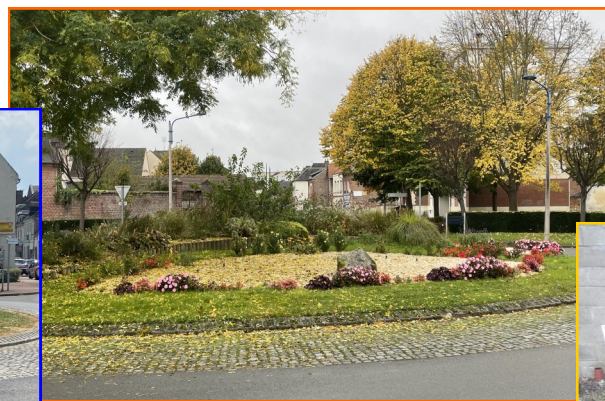
Le rond-point après