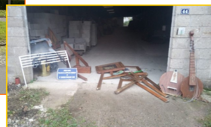
Les décorations détruites récupérées par les services techniques